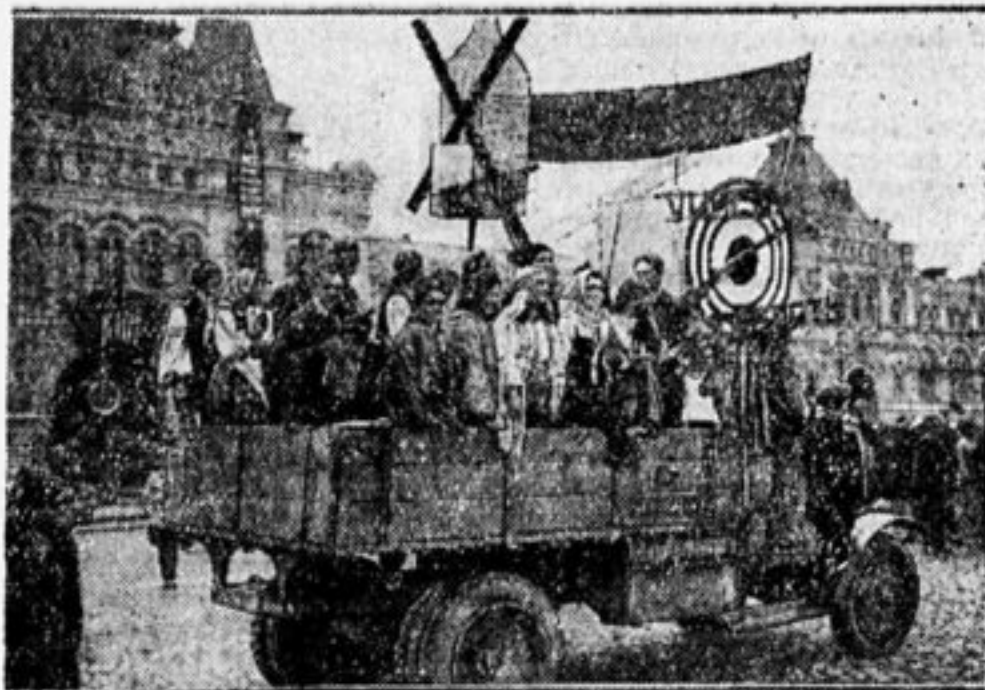
Карнавальная группа стрелкового кружка с макетом «Борьба с водкой».