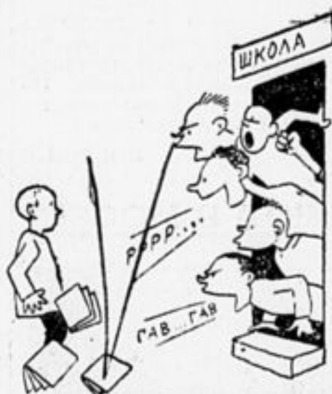
Так часто встречают новичков.

В школах крепки еще гимназические традиции. Новых учеников подвергают «боевому крещению». Встретить растерянного новичка щелчком по носу—считается доблестью. Мы поднимаем голос против такой встречи. Кто с нами, тот встретит новых товарищей тепло и приветливо.